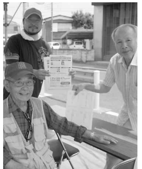
署名活動にも取り組みました