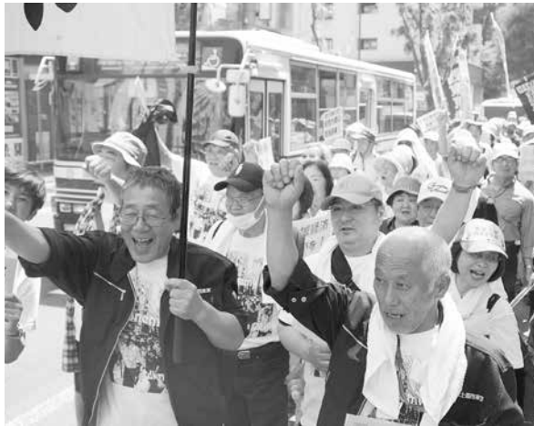
街でデモ行進のようす

勤務が当たり前だった当時8時間勤務労働制を訴え統一ストライキを行ったことに由来します。メーデーがきっかけで現在の8時間勤務が実現しました日本でも1920年に第一回メーデーが東京の上野公園で行われて以来現在も開催されています。西東京支部でも毎年三多摩メーデーに青年部主催のデコカーやTシャツなどを作成して参加しています。今年は新型コロナウイルス感染防止の観点から参加を自粛しましたが、私たち働く