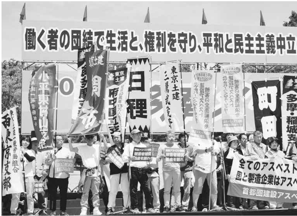
多くの仲間が集まります